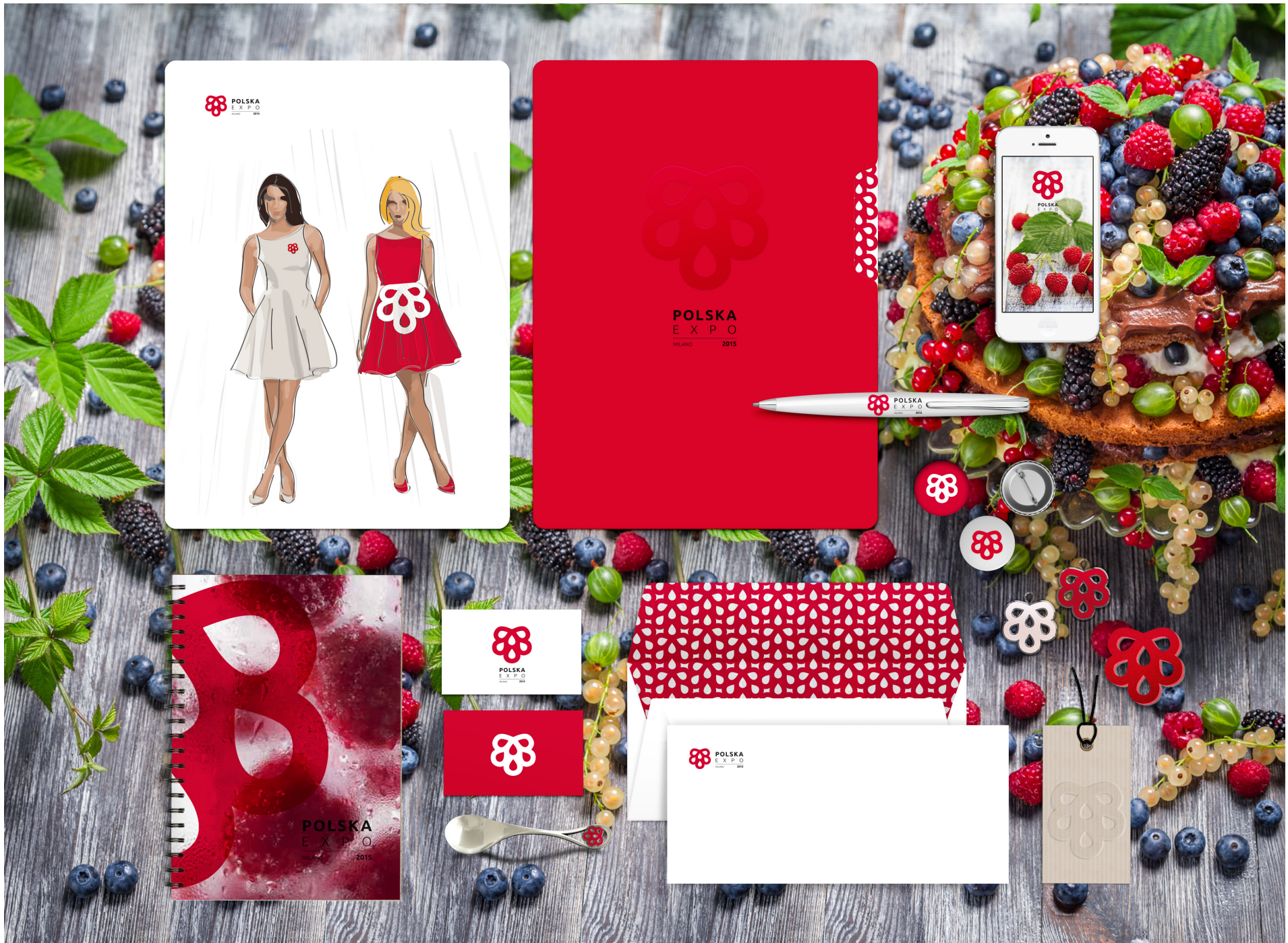
POLSKA EXPO Milano 2015 | Wybrane elementy identyfikacji marki